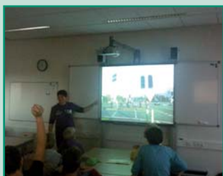
'Jouw route in beeld', bij een brugklas op het ISW in Naaldwijk

Ik ben drie dagen per week als verkeersleerkracht in dienst bij OnderwijsAdvies. De eerste drie jaar heb ik scholen gehad in de regio Holland Rijnland (Leiden en omstreken). Na drie jaarcontracten ben ik er drie maanden uitgegaan, om daarna weer in dienst van OnderwijsAdvies te kunnen komen. Ik heb nu scholen in Stadsgewest Haaglanden, alle randgemeenten van Den Haag.