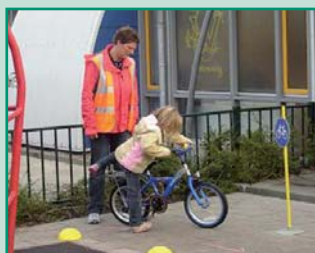
De drempel zo laag mogelijk