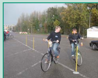
'Voortgezet Fietsvaardigheid' op het Teylingencollege in Voorhout

Er heeft natuurlijk wel een verschuiving plaatsgevonden in de werkzaamheden. Vijf jaar geleden gaf ik voornamelijk praktische lessen (grotendeels zelf verzonnen) aan alle groepen van de basisschool. Nu is het de bedoeling dat de leerkrachten deze lessen gaan geven, dus er is veel meer overleg nodig met de leerkrachten. Inmiddels kunnen we werken met de prachtige mappen "Verkeerskunsten", waardoor het gemakkelijker over te dragen is. Ook krijgen scholen die meedoen aan het project "verkeersleerkracht" deze lesmappen en twee grote kisten met materialen. We doen er alles aan om de drempel zo laag mogelijk te maken om de praktische verkeerslessen te laten geven op een school.