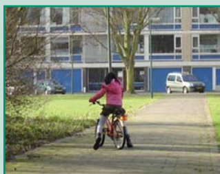
'Leren fietsen' in groep 6. Een kwestie van doorzetten!